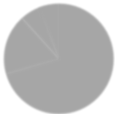
Первый и второй годы